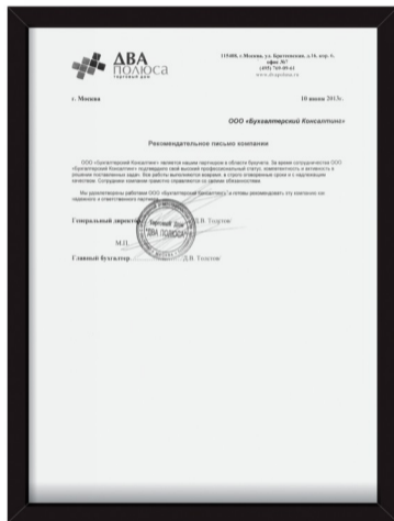
ООО ТД «Два Полюса»