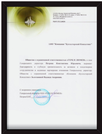
ООО «Герц и Люмен»