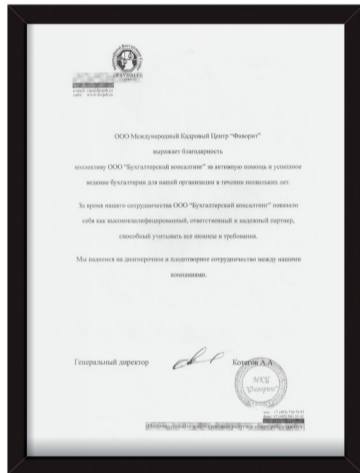
ООО МКЦ «Фаворит»